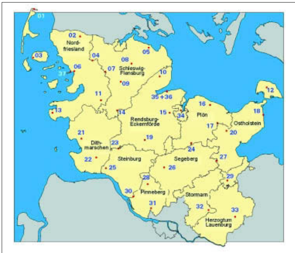
Abbildung 1: Lage der Boden-Dauerbeobachtungsflächen

brauches, die Vermeidung schädlicher Bodenveränderungen sowie die Sicherung und Wiederherstellung von Bodenfunktionen. Die Boden-Dauerbeobachtung dient insbesondere dem vorsorgenden Bodenschutz und will hier vor allem Veränderungen dokumentieren, Beweise sichern, Ursache-Wirkungs-Beziehungen analysieren, Risiken für Böden beurteilen und Prognosen abgeben. Um möglichst alle im Land wesentlichen und typischen Standorte zu beobachten, hat das Landesamt für Natur