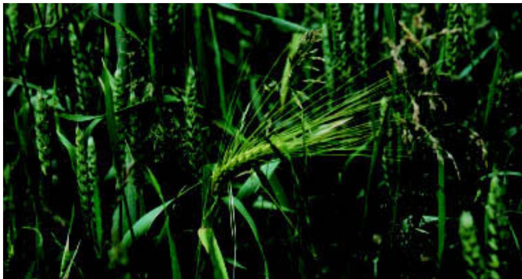
Abbildung 5: Getreidepflanzen auf einem intensiv genutzten Acker- standort

Für einen Großteil der Ackerstandorte waren die festgestellten Veränderungen im Bestand der Ackerbegleitflora gering und lagen im Bereich natürlicher Schwankungen. Die meisten Veränderungen sind durch Fruchtfolgen bedingt. Vereinzelt hat das Witterungsgeschehen zu drastischen Änderungen geführt. Auf jeweils zwei BDF finden sich in der Vegetationsentwicklung Hinweise auf Grundwasserabsenkungen sowie auf eine bessere Stickstoffversorgung. Die Vegetation einer weiteren Fläche lässt erkennen, dass die Böden nicht mehr so sauer sind.