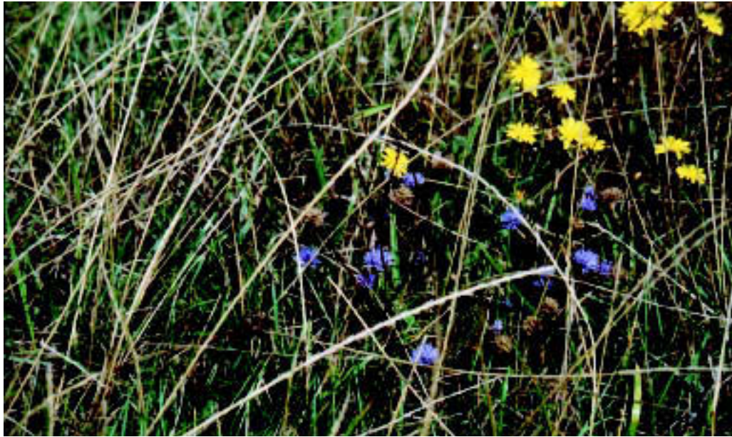
Abbildung 6: Wiesenblumen auf einem extensiv ge- nutzten Grünland- standort

Standorten in der Samenbank Staunässezeiger, die aktuell nicht entwickelt waren. Wahrscheinlich kommen diese Samen dann zur Keimung, wenn es auf den Flächen zu Bodenverdichtungen und damit zu Staunässe kommt. Deutliche Unterschiede konnten auch hinsichtlich der Stickstoffzeiger festgestellt werden. Auf mehreren BDF fanden sich in den Samenbanken deutlich höhere Anteile von Arten stickstoffärmerer Standorte. Diese Arten scheinen unter den hohen Stickstoffgaben auf intensiv genutzten Ackerflächen kaum noch Entwicklungsmöglichkeiten zu finden.