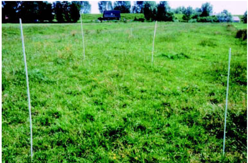
Abbildung 3: Gekennzeichnete Boden-Dauerbeob- achtungsfläche im Gelände